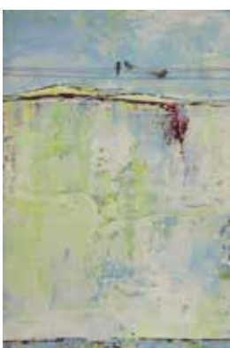
Idealformat 40 x 60, oder 50 x 50 cm

Manueller Druck mit diversen Druckplatten oder Folien und Acrylfarbe überdrucken wir die Flächen, bis es uns gefällt. Wir lassen uns von der Natur und ihren Formen inspirieren.