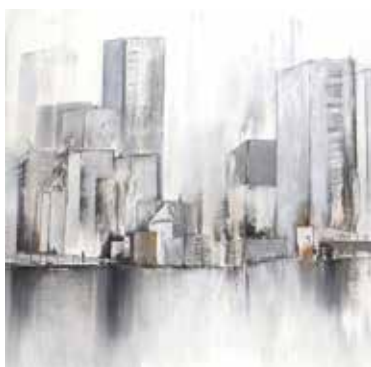
Obligatorisches Format 50 x 50 cm

Wir gestalten mit Strukturen und wenigen bunten Farbtupfern einen weiss in weiss Hintergrund. Dann übertragen wir mit der Transver-technik einen Teil der Laserkopie auf das Bild. Die Farbtöne werden später noch angepasst.