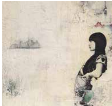
Idealformat 40 x 40, 50 x 50 oder 50 x 70

Kursleitung: Renate Moser Fr. 500.- je Block (8 Abende) 19.00 Uhr - 21.45 Uhr, jeden 2. Dienstag-Abend